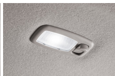
LED 선바이저 램프