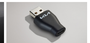
A to USB-C 변환 젠더*