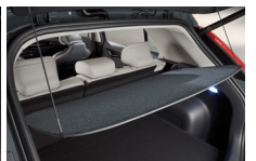
러기지 스크린 ※ 애프터 마켓 별도 구매 가능