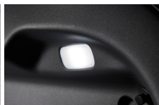
LED 러기지 램프