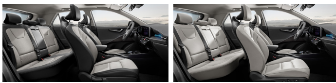
바이오 인조가죽시트 (미디어 그레이 인테리어)