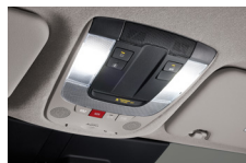
LED 오버헤드콘솔 램프