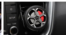
휠 디자인 디퓨저