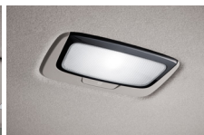
LED 룸 램프