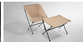
캠핑 의자 & 테이블