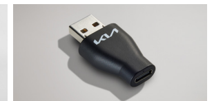
A to USB-C 변환 젠더*