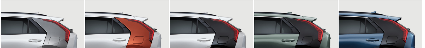
스노우 화이트 펠(C 필라 - 스틸 그레이)