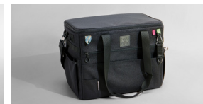
캠핑용 수납 가방